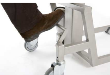
Zentralbremse und Steuerung