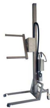
Pharma Lift mit Dreheinheit