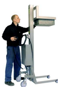
Schäfer Kästen N-150M-Fsp