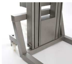
Motorabdeckung (SP/SF) als Option