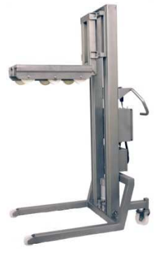
Gabel für Trolley, Food SF-300M-FSH