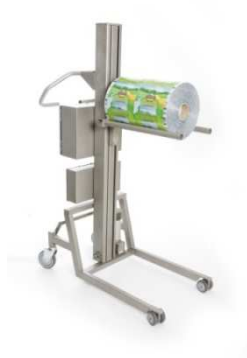
Doppelt Dorn SP-150L-DBL