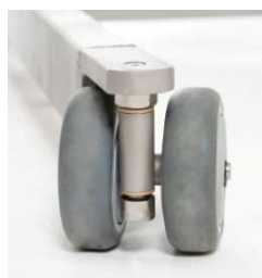
Vorderradgehäuse aus Edelstahl (SN/SP/SF)