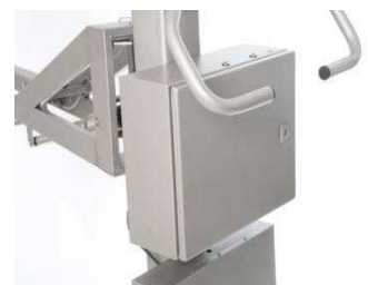
Elektronikkasten IP66 (SP/SF) oder als Option