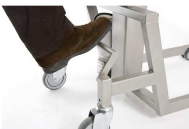
Zentralbremse und Steuerung