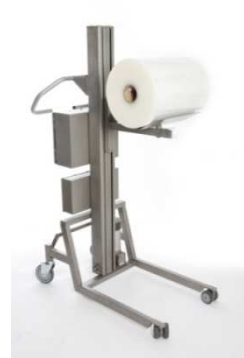
Drehbarer V-Block SP-150L-BVB4