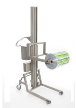
Heben in der Welle SP-150M-FSXL